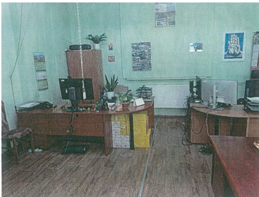
Zdjęcie nr 2 – widok pomieszczenia rozliczenia czasu pracy w Oddziale Przewozów R1 „Woronicza”.